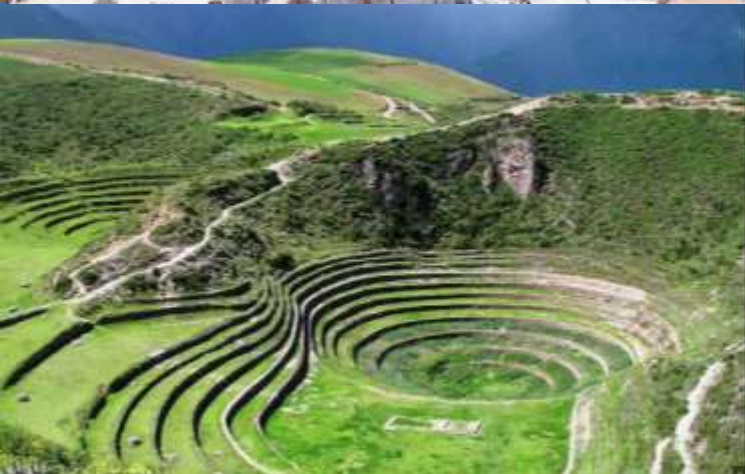
บ่าย นำท่านเดินทางสู่ มาราซ (Maras) แหล่งผลิตเกลือที่คุณภาพดีที่สุดในโลก ที่มีมาตั้งแต่สมัยอินคา แนวนาชั้นบันไดที่เรียงอยู่ตามลำดับความสูงของภูเขา จากนั้นเดินทางสู่ โมเรย์ (Moray) นาชั้นบนโดวงกลมขนาดใหญ่หลายวงรูปร่างแปลกตาที่ชาวอินคาทำไว้เพื่อทดลองปลูกพืชพันธุ์ต่างๆ จากจุดนี้สามารถมองเห็น หมู่บ้านอุรัมบัмба (Urubamba) ได้อีกด้วย ได้เวลาเดินทางกลับสู่เมือง เมืองคัสโก (Cusco) เมืองหลวงของอาณาจักรอินคา ที่แพร่ขยายอำนาจจนกินพื้นที่ 1 ใน 3 ของอเมริกาใต้ ตั้งอยู่เหนือระดับน้ำทะเลถึง 3,400 เมตร และเป็นแหล่งอารยธรรมยุคก่อนประวัติศาสตร์ที่ลึกลับน่าทึ่ง เป็นชุมชนเก่าแก่ของจักรวรรดิอินคาอันรุ่งเรือง ซึ่งยังคงทิ้งร่องรอยความเจริญไว้ให้เห็นเป็นซากปรักหักพังโบราณและโบราณวัตถุต่างๆ