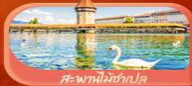
สะพานไมซ์ฮักปด

Highlight เยือนหมู่บ้านแสนสวยเซอร์แมท เช็กอินศาลาไทยสุดงามที่โลซาน เที่ยวลูเซิร์น ชมสะพานไม้ชาเปลและอนุสาวรีย์สิงโต ซาสี แอปสลิน ชมประติมากรรม The Fork และปราสาทซิลลองริมทะเลสาบ เยือนมิลาน มหาวิหารดูโอโม เที่ยวเวนิส เมืองลอยน้ำสุดโรแมนติก อินกับรักอมตะที่บ้านจูเลียต และช้อปปิ้งจุใจที่ Serravalle Outlet