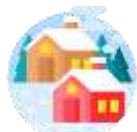
เมืองเซอร์แมท

เช้า บริการอาหารเช้า ณ ห้องอาหารของโรงแรม (11)