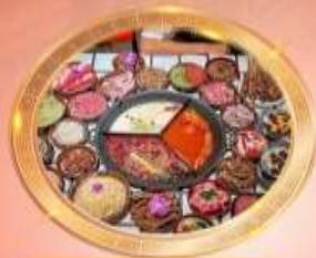
บุฟเฟต์หมีโพล่งซิ่ง