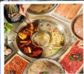
หม้อไฟหมาล่า