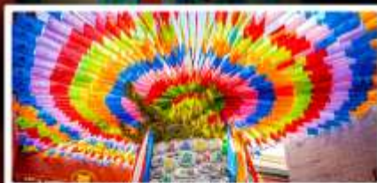
วัดลามะกว้างเหิน