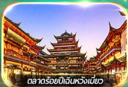
ตลาดร้อยปีเดินหวังเหมียว