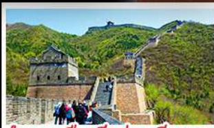
กำแพงเมืองจีนด้านจวียงกวน