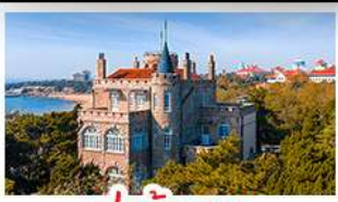
ป่าตักกวน

พระราชวังฤดูร้อน - วิวเมืองซิงเต่า รถไฟความเร็วสูง - ภูเขาเหลาซาน กำแพงเมืองจีนด้านจวียงกวน - ป่าตักกวน พักโรงแรมระดับ 4 ดาว - ไม่ลงร้านซื้อ มือพิเศษ เปิดปักกิ่ง , หม้อไฟซีฟู้ด