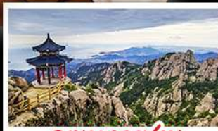
ภูเขาเหลาซาน