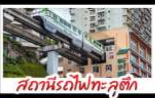
สถานีรถไฟทะลุคัง

ดงชิง - อุโมงค์ - หงหยาดัง อุทยานเขานางฟ้าดงชิง สถานีรถไฟทะลุคัง หลุมฟ้าสามสะพานสวรรค์