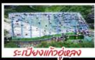
ระเบียงงิ้วแก้วอุโมงค์