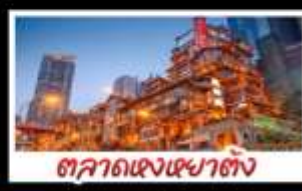
ตึกแดงเฉาตัง