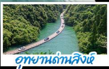
อุทยานด้านสิงห์