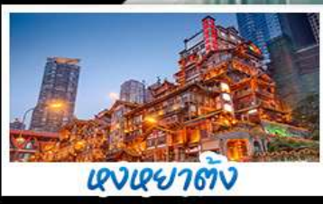
แสงเซาตัง