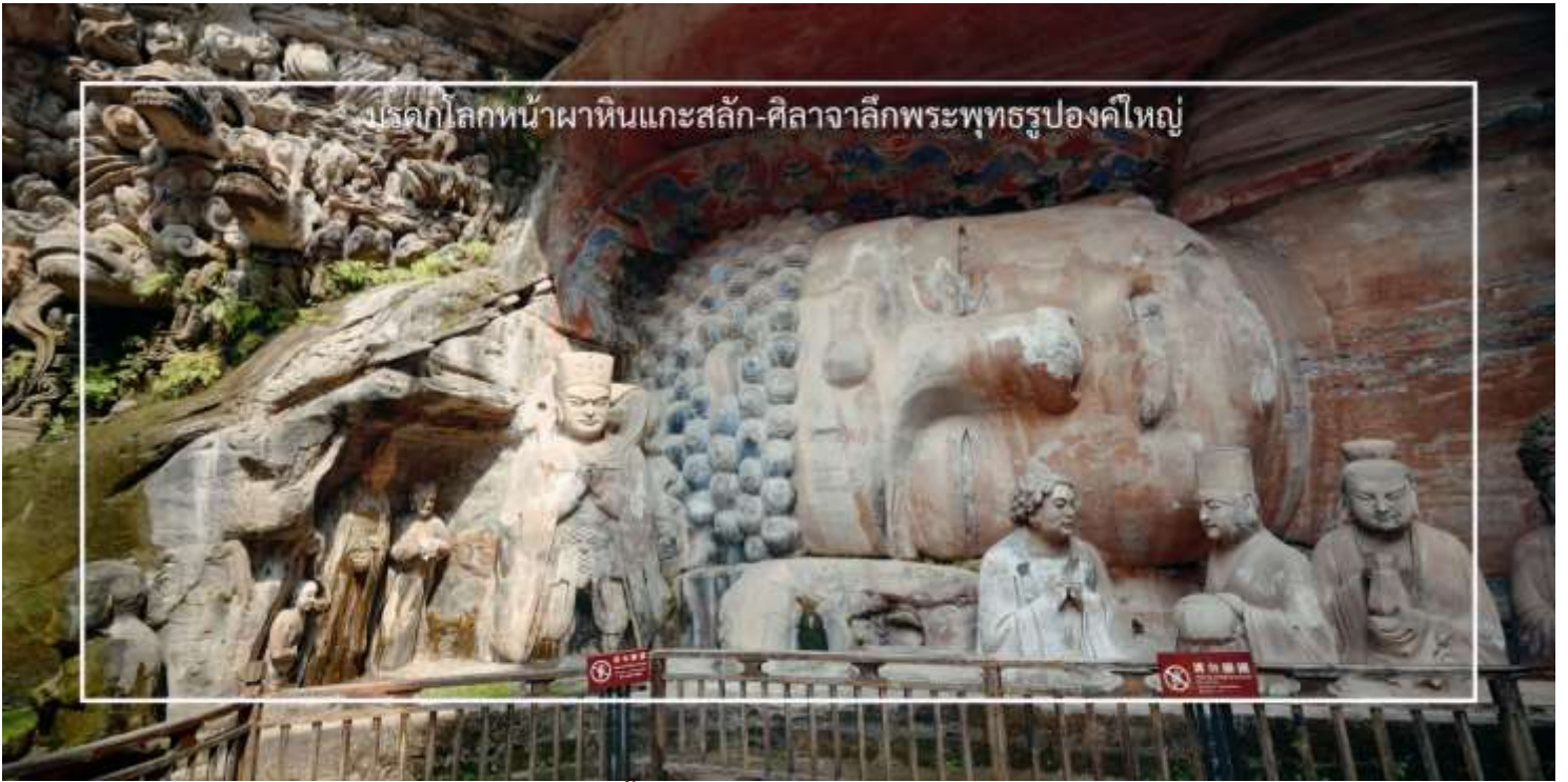
บรรดกโลกหน้าผาหินแกะสลัก-ศิลาจากลิกพระพุทธรูปองค์ใหญ่

เที่ยง บริการอาหารเที่ยง ณ ภัตตาคาร (มื้อที่ 11)