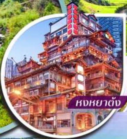
หงหยาดั่ง