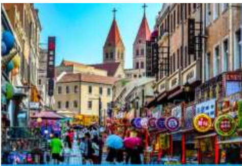
ถนนววงซาน

หลังอาหารนำท่านเดินทางชม สะพานจ้านเจียว 栈桥 เป็นแลนด์มาร์กแห่งประวัติศาสตร์คู่เมืองชิงเต่า สร้างเมื่อปี ค.ศ.1891 มีลักษณะเป็นสะพานหินทอดยาวกว่า 440 เมตรสู่ทะเล ปลายสะพานมีศาลา ทรงแปดเหลี่ยมสีแดงที่โดดเด่น ซึ่งเป็นสัญลักษณ์บนฉลากเบียร์ชิงเต่า ขึ้นชื่อเรื่องวิวสวย รับลมทะเล ให้ท่านเก็บภาพบรรยากาศ