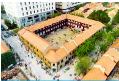
เมืองเก่าเยอรมัน ตรอกกว้างซิงหลี่

จากนั้นนำท่านเดินเที่ยวชม ถนนจงซาน 中山路 ถนนที่เต็มไปด้วยกลิ่นอายยุโรป และถนนสายนี้มีบันทึกเรื่องราวมากกว่าศตวรรษของเมืองชิงเต่าไว้ ที่นี่เป็นศูนย์กลางการค้าแห่งแรกที่เต็มไปด้วยสถาปัตยกรรมสไตล์ยุโรปเก่าแก่ที่ได้รับอิทธิพลมาจากเยอรมัน ให้ท่านได้เดินเก็บบรรยากาศ และ เก็บภาพกับ โบสถ์เซนต์ไมเคิล (ด้านนอก) โบสถ์แห่งนี้ที่คู่รักนิยมมาถ่ายภาพงานแต่งงานมากที่สุดในเมืองชิงเต่า ให้ท่านถ่ายรูปเก็บภาพ