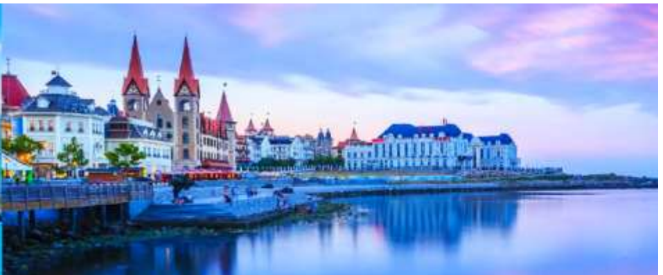
ท่าเรือชาวประมงไห่หาง