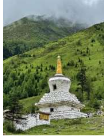
ที่สวยงาม อีสะพานพักผ่อนชมวิวะระหว่างทางจน