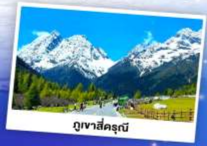
ภูเขาสี่ครุณี