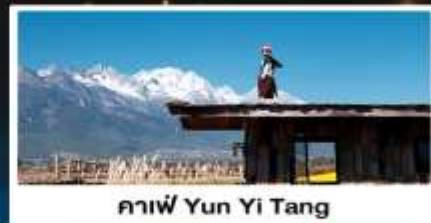
คาเฟ่ Yun Yi Tang