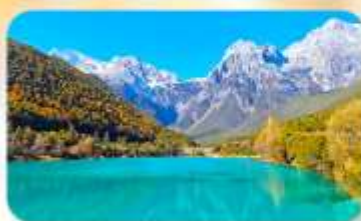
ทะเลสาบโป้สุยเหอ