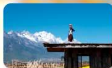
กาแฟ Yun Yi Tang