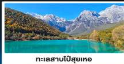
ทะเลสาบโปสุยเหอ