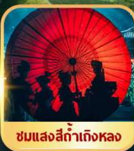
ชมแสงสีท่าเกิงหลง