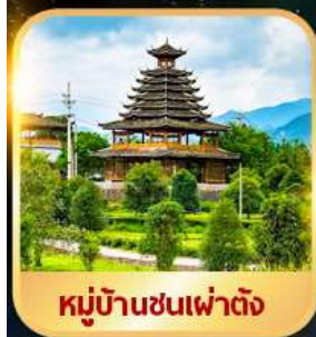
หมู่บ้านชนเผ่าต้ง