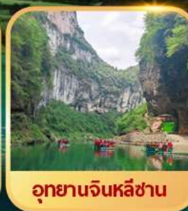
อุทยานจินหลีซาน