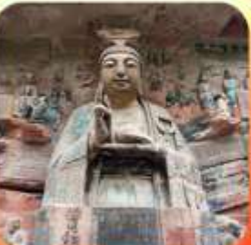
"ผาหินแกะสลักต้าจู้"