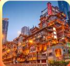
"ล่องเรือชมวิวหงหยาดัง"