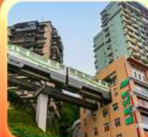
"นั้งรถไฟทะลุตึก"