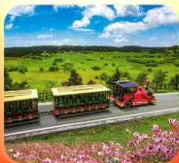
"อุทยานเขานางฟ้า"

บินตรงลงชิง • อยู่หลง หลุมฟ้าสะพานสวรรค์ • ระเบียงแก้ว • อุทยานเขานางฟ้า หงหยาดัง • นั้งรถไฟทะลุตึก • ล่องเรือชมฉางชิ่งยามค่ำคืน • ศาลาประชาม (ด้านนอก) มรดกโลกผาหินแกะสลักต้าจู้ • เมืองโบราณสี่ปาตี้ • วัดหลิวฮั่น • ตึกตะเกียบ