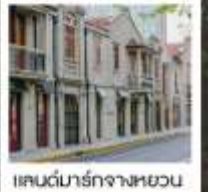
แลนด์มาร์กจางหยวน

เซี่ยงไฮ้ คาสสิก ไนท์ / 3 ดึกใหญ่แห่งเซี่ยงไฮ้ คองเรือหมู่บ้านโบราณจูเจียเจียว / EKA Tianwu / วัดหลงหัว แลนด์มาร์ก จางหยวน / ถนนหวยไห่ / ชมโชว์ ERA ที่โรงละครโด่งดังระดับโลก / ซินเทียนตี้