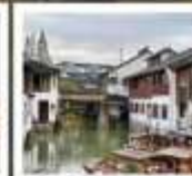
เมืองโบราณซูเจียเจียว