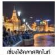
เซี่ยงไฮ้คาสสิกไนท์