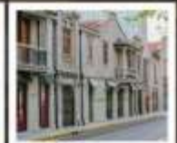
แลนด์มาร์กจากหยวน