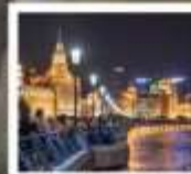
เซี่ยงไฮ้คลาสสิกไนท์