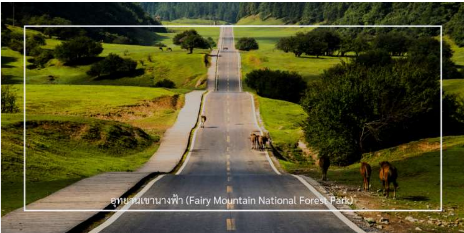
อุทยานเขานางฟ้า (Fairy Mountain National Forest Park)

อุทยานเขานางฟ้า ตั้งอยู่ในเขตอู่หลง มหานครฉงชิ่ง ประเทศจีน เป็นสถานที่ท่องเที่ยวทางธรรมชาติระดับ 5A ของประเทศ โดดเด่นด้วยภูมิประเทศแบบที่ราบสูงอัลไพน์ ปกคลุมด้วยทุ่งหญ้ากว้าง ป่าไม้เขียวขจี และยอดเขาสลับซับซ้อนสวยงามราวภาพวาด ด้วยบรรยากาศเย็นสบายตลอดทั้งปี ที่นี่จึงได้รับฉายาว่า “สวิตเซอร์แลนด์แห่งจีน” อุทยานครอบคลุมพื้นที่กว่า 330 ตารางกิโลเมตร มีระดับความสูงเฉลี่ยกว่า 2,000 เมตรจากระดับน้ำทะเล ภายในท่านสามารถเพลิดเพลินกับการเดินเล่นชมธรรมชาติบน ‘สะพานสวรรค์’ (Glass Skywalk) ชมทิวทัศน์อันงดงามของภูเขาและทะเลหมอก พร้อมบริการรถไฟขบวนเล็ก ที่จะพาท่านชมวิวมกกลางธรรมชาติได้อย่างสะดวกสบาย