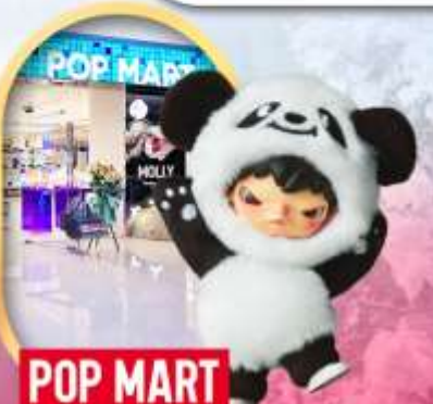
ช้อปปิ้งร้าน Pop Mart