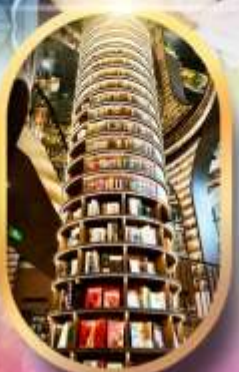
หอหนังสือจางชู่เก้อ