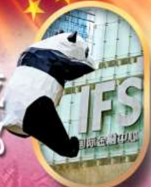
IFS หนีแพนด้าป็นตึก