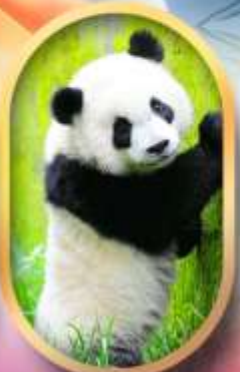
ศูนย์อนุรักษ์หนีแพนด้า