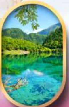
จิ่วจ้ายโกว