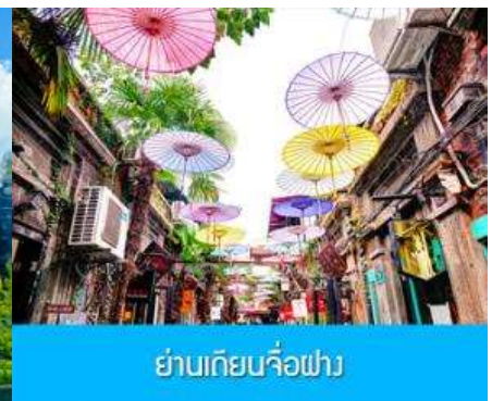
ย่านเกียบจื่อฝาง