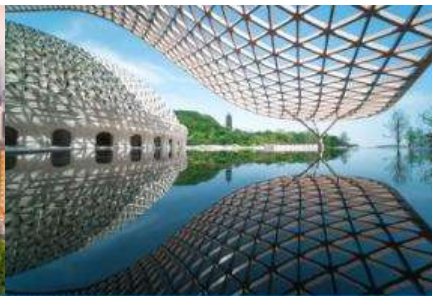
อุทยานกุ่มกึ่งยวหนิวโล้วซาน