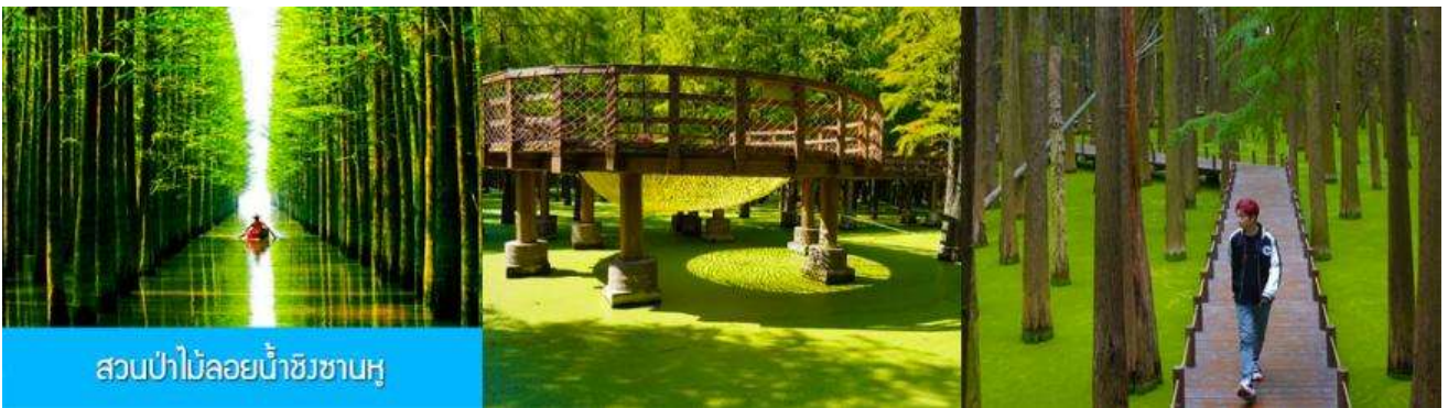
สวนป่าไม้ลอยน้ำชิงชานหู

พักที่ โรงแรม Holiday Inn Express Hotel 4* หรือเทียบเท่าในนครเซี่ยงไฮ้