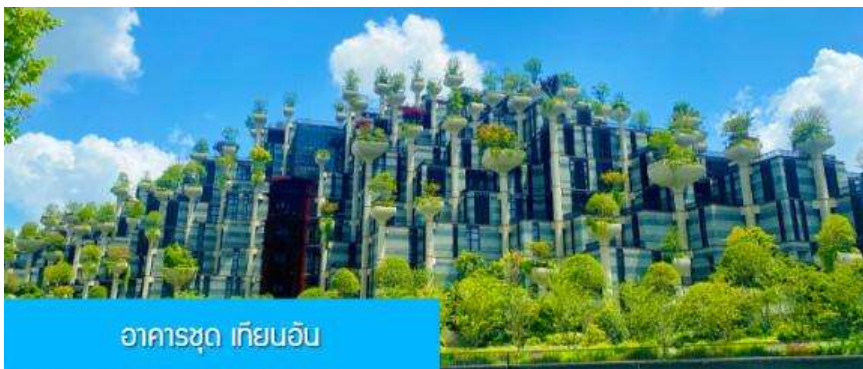
อาคารชุด เทียนอัน

เที่ยง รับประทานอาหารกลางวัน ณ ภัตตาคาร (6)