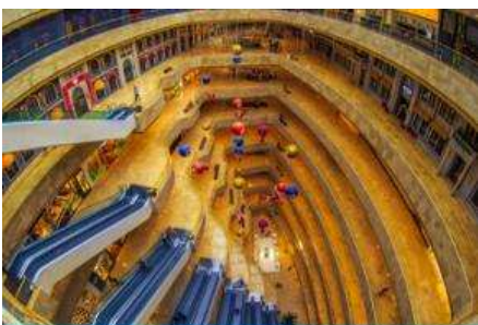
จัตุรัสเต๋อจี

พักที่ โรงแรม Holiday Inn Express Dongshan Hotel 4* หรือเทียบเท่าในนครหนานจิง