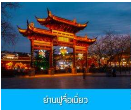
ย่านฟูจื่อเมี่ยว