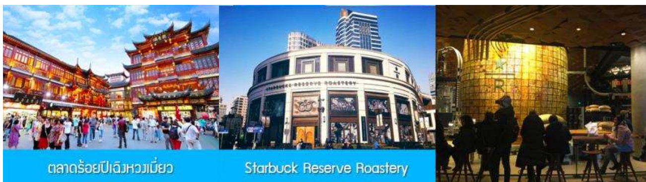
ตลาดร้อยปีฉิวหวงเมี่ยว

พักที่ โรงแรม Holiday Inn Express Hotel 4* หรือเทียบเท่าในนครเซี่ยงไฮ้