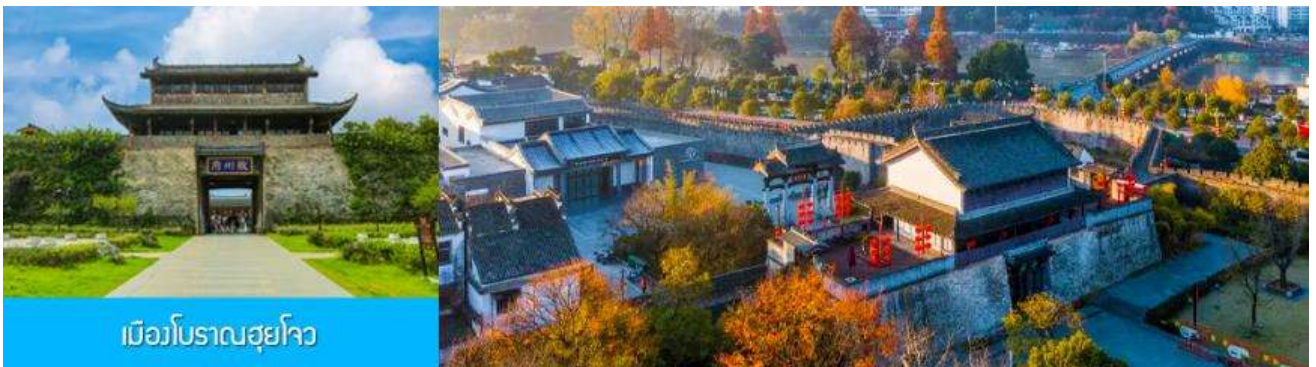
เมืองโบราณซูโจว

จากนั้นนำท่านเดินทางโดยรถบัสสู่ เมืองโบราณซูโจว (ระยะทาง 149 กม. ใช้เวลาเดินทางราว 2 ชั่วโมงเศษ)