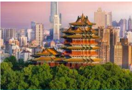
นครนานกิง