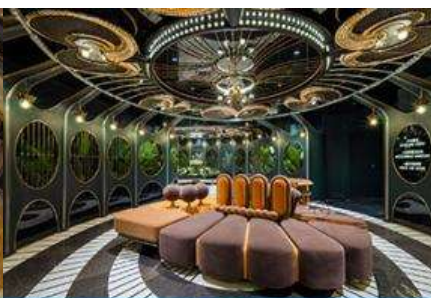
ห้องน้ำไอเทค