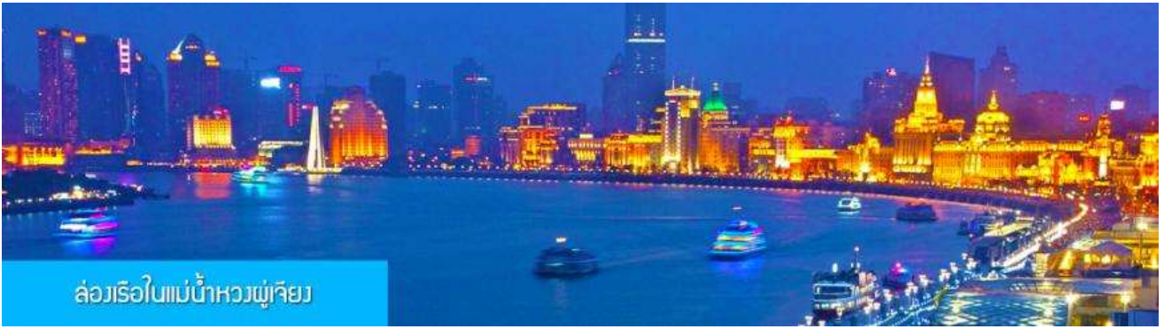
ล่องเรือในแม่น้ำหวงผู่เจียง