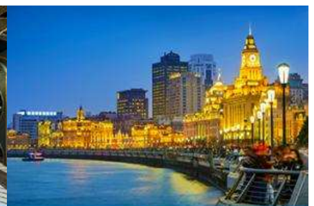
หาดไว่กาน