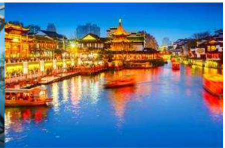
ย่านฟูจื่อเมี่ยว