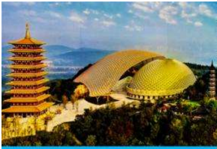
อุทยานหนิวโล่วซาน