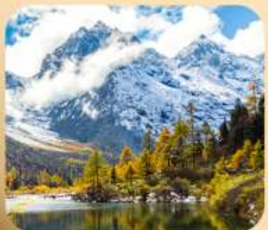
“ปี่ผิงโกว”

ชมธรรมชาติ 2 อุทยานขึ้นชื่อ อุทยานภูเขาสี่ดรุณี + อุทยานปี่ผิงโกว สะพานหนานเฉียว • ถนนคนเดินไถ่กู่หลี่ + ชุนซีลู่ + Pop Mart • ดงเจียวจื่อ