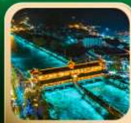
“สะพานหนานเฉียว น้ำตาสีฟ้า”