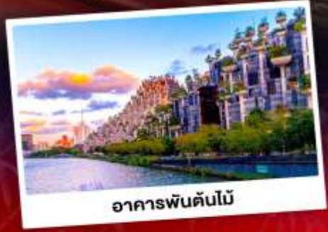
อาคารพันด้าไม้

ใกล้ชิดแพนด้าแดงแสนน่ารัก SHANGHAI WILD ANIMAL PARK ชมการแสดงพลุสุดปังที่สวนสนุกดิสนีย์แลนด์