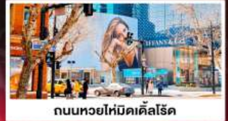
ถนนหยยไทม์ดิสโรด