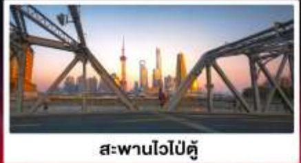
สะพานไวปี้ตู่