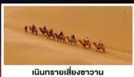
เนินทรายเสี่ยงชาวน