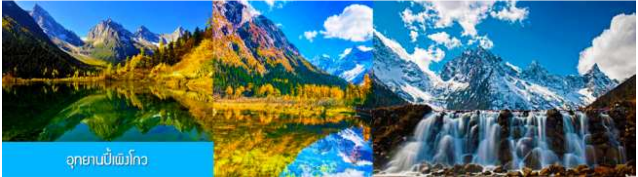
อุทยานบีเพิงโกว

หลังอาหารนำท่านเที่ยวชม อุทยานบีเพิงโกว 毕棚沟景区 ที่เป็นแหล่งท่องเที่ยวธรรมชาติที่สวยงามได้รับฉายาว่าเป็นสวิตเซอร์แลนด์แดนใต้แห่งเมืองเสฉวน ตั้งอยู่เหนือระดับน้ำทะเลระหว่าง 2,015 เมตร – 3,500 เมตร ครอบคลุมพื้นที่ 614 ตารางกิโลเมตร ได้รับการขึ้นทะเบียนเป็นอุทยานท่องเที่ยวธรรมชาติระดับ 4A ของจีนในปี ค.ศ. 2013 และกลายเป็นอุทยานท่องเที่ยวยอดนิยมที่มีนักท่องเที่ยวเดินทางมาเยือนในปี 2023 ... นำท่านขึ้นรถบัสของอุทยานเพื่อเข้าไปยังเขตอุทยาน นำท่านขึ้นรถกอล์ฟแวะเที่ยวจุดชมวิวสำคัญต่าง ๆ ภายในเขตอุทยาน ที่ประกอบด้วย ธารน้ำแข็งและภูเขาหิมะ โอบล้อมอุทยาน ทะเลสาบที่มีสีน้ำเขียวมรกต ป่าไม้ ลำธารน้ำใสสะอาด น้ำตก หุบเขาบนพื้นที่สูง ใบไม้เปลี่ยนสีและป่าไม้หลากสีในฤดูใบไม้ร่วง หุบดอกไม้อันฤดูใบไม้ผลิ โดยมีจุดชมวิวขึ้นชื่อต่าง ๆ อาทิ เขาอูฐ เขากระต่าย เขาสิงค์โต น้ำตกมังกรเขียว ทะเลสาบจิวหม่า และอ่าววงพระจันทร์ ฯลฯ จนครบแ่เวลา นำคณะขึ้นรถบัสออกจากอุทยาน นำท่านเดินทางโดยรถบัสกลับเมืองดูเจียงเยียน