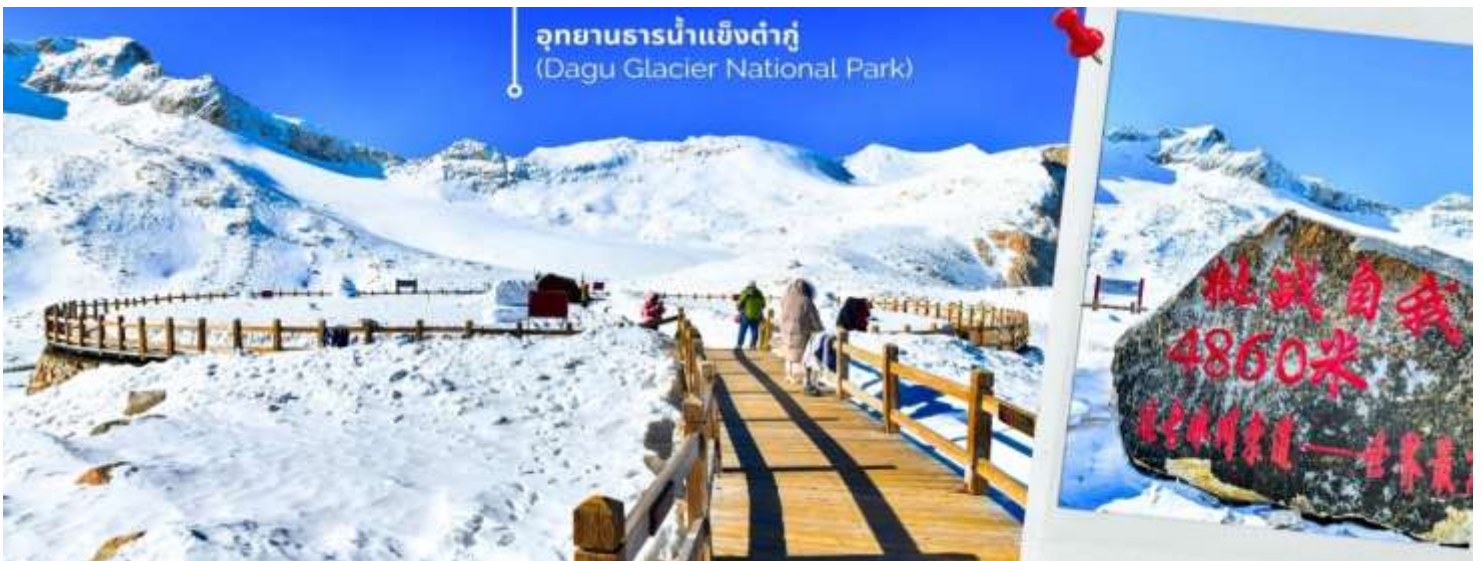
การตกและความหนาวของหิมะขึ้นอยู่กับสภาพอากาศ

จากนั้นนำท่านเดินทางสู่ เมืองเฮยส่วย (ใช้เวลาเดินทางประมาณ 2.5 ชั่วโมง) เพื่อเดินทางไปยัง อุทยานธารน้ำแข็งต้ากู่ปิงชวน(รวมกระเช้าขึ้นลง) ต้ากู่ปิงชวน หรือ Dagu Glacier National Park เป็นธารน้ำแข็งกลาเซียร์ที่สวยงามที่สุดแห่งหนึ่งของโลก และเป็นสถานที่ท่องเที่ยวระดับ 4A ของจีน ตั้งอยู่ที่เมืองเฮยส่วย ในมณฑลเสฉวน ห่างจากเมืองเฉิงตูประมาณ 300 กิโลเมตร ถือเป็นธารน้ำแข็งที่อายุน้อยที่สุด ที่ตั้งอยู่ในระดับความสูงที่ต่ำที่สุด และอยู่ใกล้กับเมืองมากที่สุดในบรรดาธารน้ำแข็งทั้งหมด โดยอยู่สูงจากระดับน้ำทะเลประมาณ 3,800-5,100 เมตร จุดสูงที่สุดที่นักท่องเที่ยวสามารถขึ้นไปได้จะอยู่ที่ 4,860 เมตร