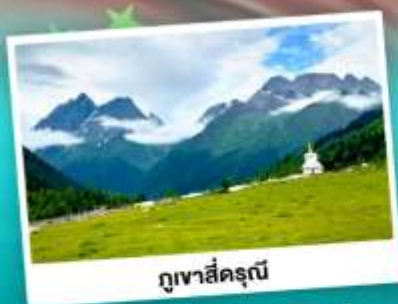
ภูเขาสีครุณี

ชมความสวยงามทุ่งหญ้าด่าง เทือกภูเขาสีครุณี อุทยานยาดิง "แซงกรีทว่าแห่งสุดท้าย" S-คืบ 5A