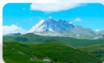
ทุ่งหญ้าด่าง