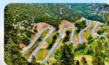
ถนน 18 โค้ง