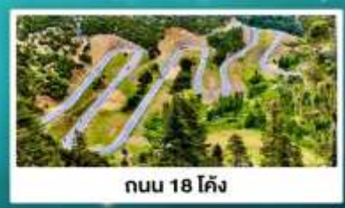
ถนน 18 โค้ง