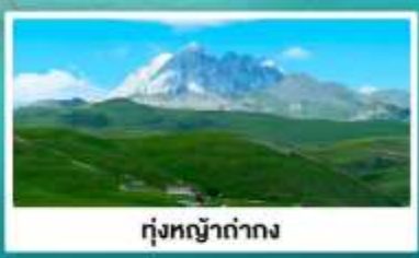
ทุ่งหญ้างด่าง