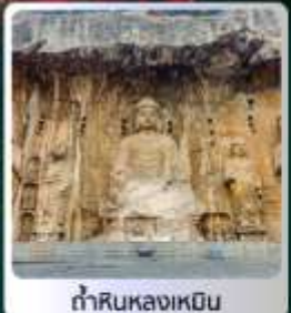
ถ้ำหินหลุมฝังศพ