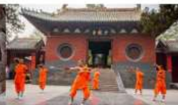
ชมโชว์กังฟูเส้าหลิน

*ทางบริษัทฯ ขอสงวนสิทธิ์ในการสลับโปรแกรมทัวร์ตามความเหมาะสมขึ้นอยู่กับสถานการณ์หน้างาน โดยคำนึงถึงผลประโยชน์ของลูกค้าเป็นสำคัญ