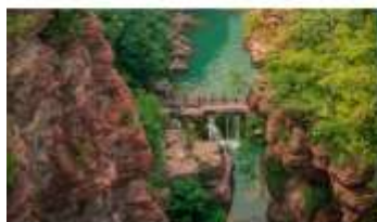
อุทยานสวรรค์หยุนโตซาน