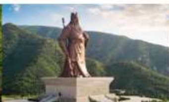
บ้านเกิดท่านกวนอู