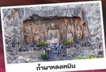
ถ้ำผาหลงเหมิน