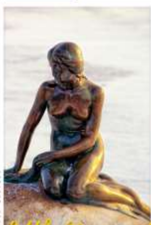
The Little Mermaid

รับประทานอาหารกลางวัน ณ RESTAURANT VITA (15) หรือเทียบเท่า