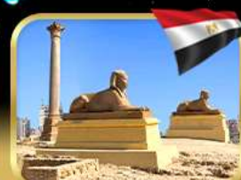
เสาริมันปอมเปย์