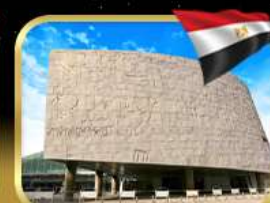
ห้องสมุดอเล็กซานเดรีย