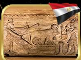
สุสานใต้ดินอเล็กซานเดรีย

เข้าชมพิพิธภัณฑ์อียิปต์แห่งใหม่ (GRAND EGYPTIAN MUSEUM)