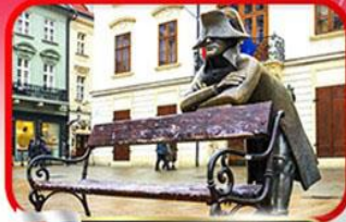
ย่านเมืองเก่าปราทิสลาวา

เที่ยวเมืองสวยริมทะเลสาบ ฮัลล์สตัดท์ • ชมเมืองไข่มุกแห่งโบฮีเมีย เซสกี กรุงลอน • ปราทิสลาวา • เวียนนา • ซอปปิงพาร์นดอร์ฟ เอาก์เล็ท