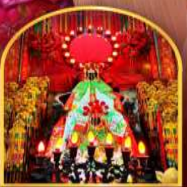
เจ้าแม่กวนอิมฮ่องกง ที่มีอายุกว่า 600 ปี

สนุกสนานไปกับสวนสนุกดิสนีย์แลนด์แบบเต็มวัน