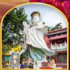
เจ้าแม่กวนอิม ฮีฟลีสเบย์ ขอพรเกี่ยวกับธุรกิจ และ การเงิน