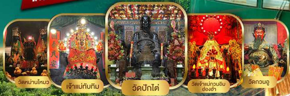
วัดหนานโหมง

ไหว้พระเสริมดวงแบบจัดเต็ม รวมขึ้นพีคแกรม