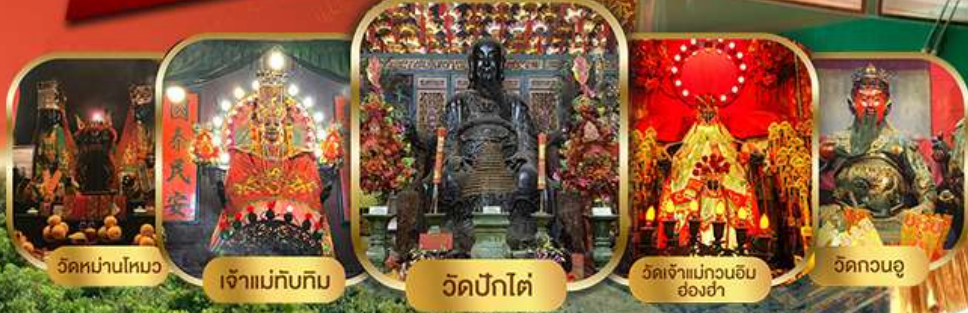
วัดหน้ามัว