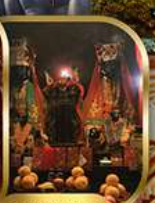
วัดหนานโถง