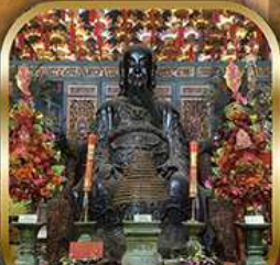
วัดปึกใต้