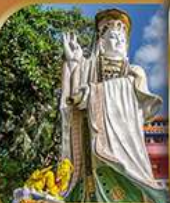
เจ้าแม่กวนอิม รวิสลบย์