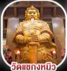
วัดเขangkงหมิว