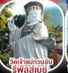
วัดเจ้าแม่กวนอิมรีพัลส์เบย์