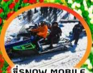
เช่า SNOW MOBILE