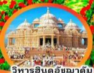
วิหารอินดูอัมมาตัม