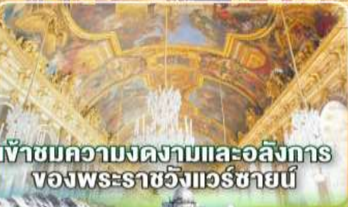
เข้าชมความงดงามและอลังการ ของพระราชวังแวร์ซายน์