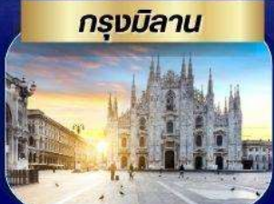
กรุงมิลาน