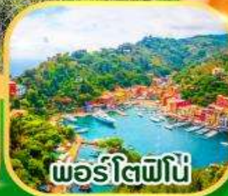
พอร์โตพิโน