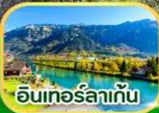
อินเทอร์ลาเกิน

เดินทาง 01-07 เม.ย. 69 7 วัน 4 คืน 29 เม.ย. - 05 พ.ค. 69