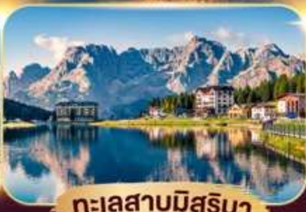
ทะเลสาบมิสุรีนา