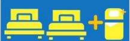
เตียง 3 ท่าน ที่นอนเสริม TRIPLE