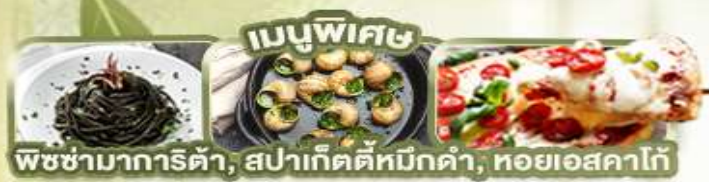
พิซซ่ามาการิตต้า, สลัดผักต้มหมักดำ, หอยแอสคาโก้