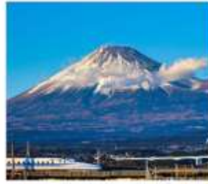
นั่งชินคันเซนชมฟูจิ