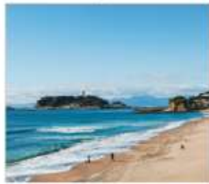
เกาะเอโนชิมะ