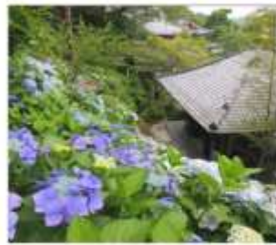
วัดฮาเซเดระ(เดรนเยีย)