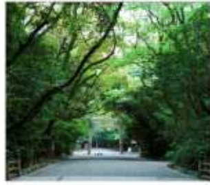
ศาลเจ้าอัสึตะ