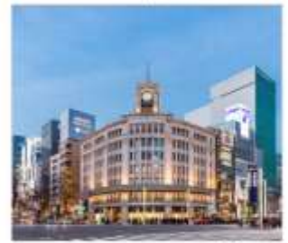
กินซ่า ช้อปปิ้ง