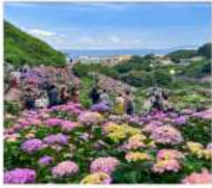
เทศกาลดอกไฮเดรนเยีย