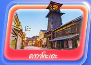
คาวาโกะระ