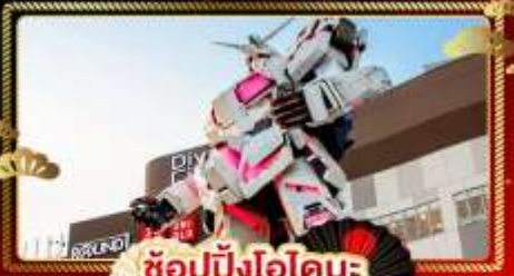
ช้อปปิ้งโอไดบะ