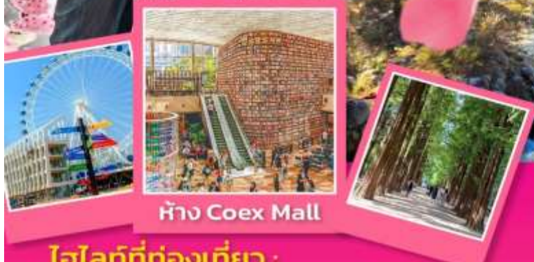
ห้าง Coex Mall

ไฮไลท์ที่ท่องเที่ยว : เที่ยวเกาะนามิ ชมชิงช้าสวรรค์ชกโชอาย วัดชินอึงซา อุทยานแห่งชาติชอรัคซาน ห้องสมุด Starfiled