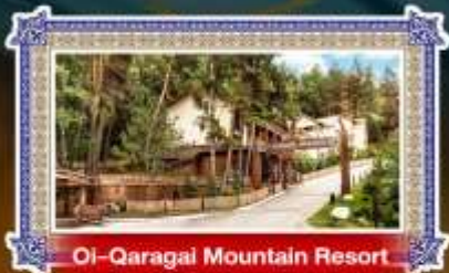
Ol-Qaragai Mountain Resort