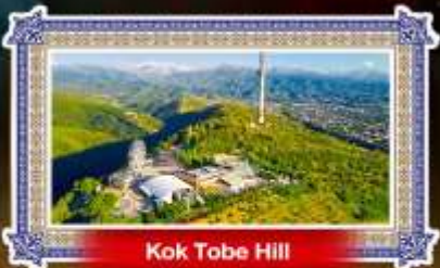
Kok Tobe Hill