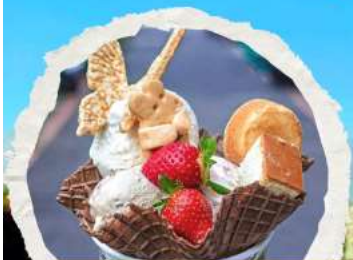
ร้าน ไอศกรีมมิยาฮาระ