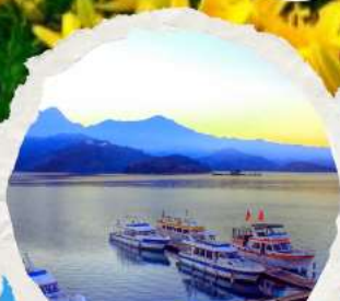
ทะเลสาบสุริยขึ้นจินฮารา